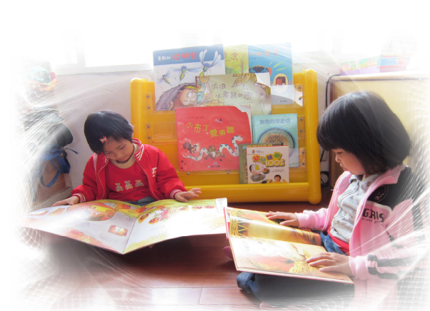
推廣喜悅閱讀 從小培養閱讀習慣與興趣