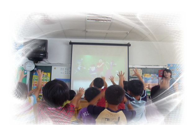
課程中融入眼睛保健的相關活動