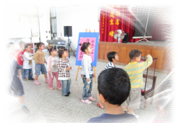
小朋友參與捐發票送愛心活動