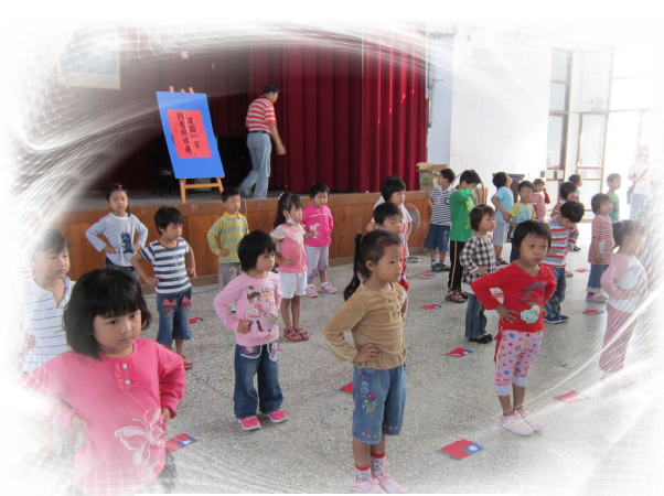
建國一百創意國旗展