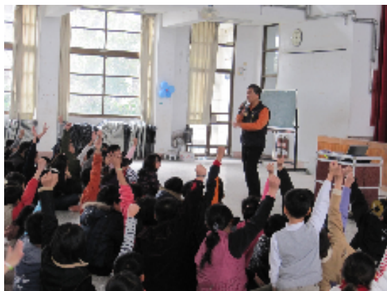
警察局婦幼隊蒞校宣導婦幼人身安全