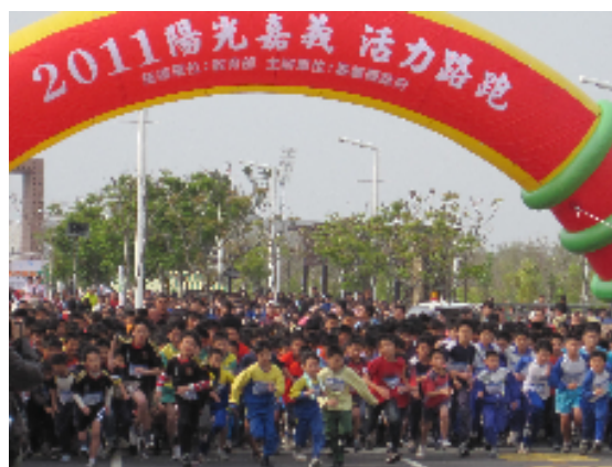
參加 2011 陽光嘉義活力路跑