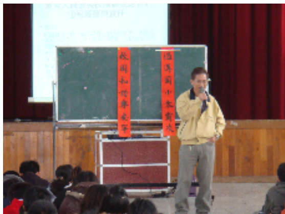
反霸凌宣導-讓孩子遠離威脅