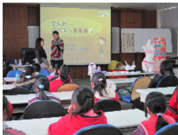
女同學生理衛教宣導-讓她們更了解自己