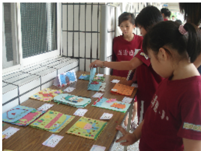
教師節卡片得獎作品展覽