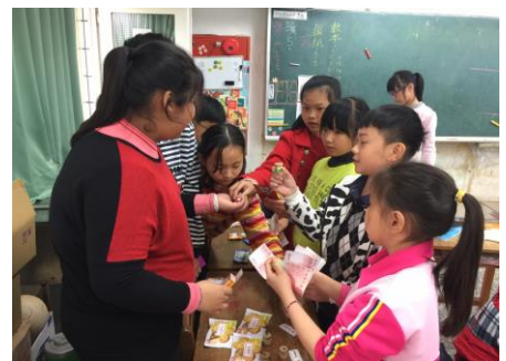
週三才藝課程—生活美語班