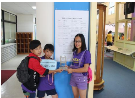
麵條抗震模型製作比賽榮獲特優