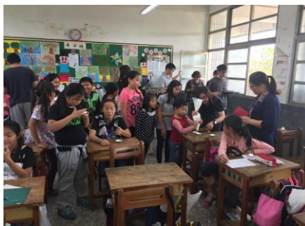
週三才藝課程—烘焙班