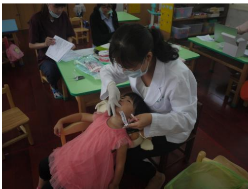
專業牙醫師到校免費幫園內幼兒塗氟