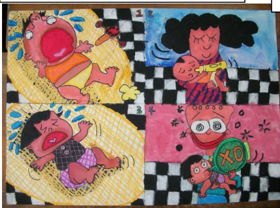
寶寶哭了 · 五甲 李佳欣