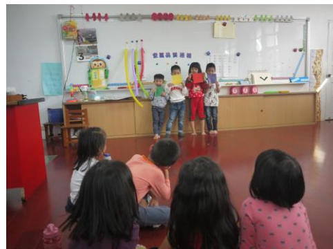
加強空氣品質教育的教學活動