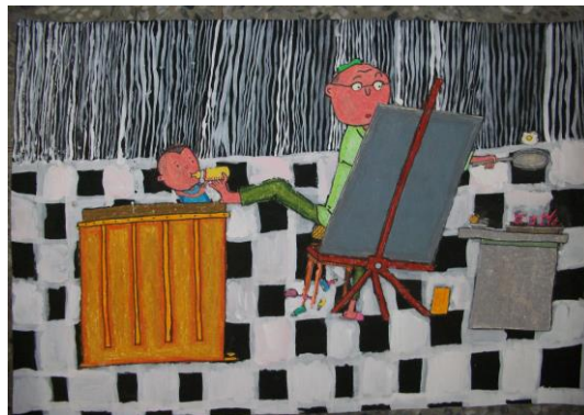
辛苦的爸爸 · 五乙 謝士平