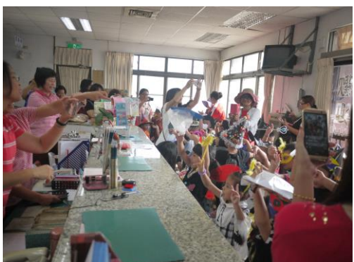
結合社區「舉辦不給糖就搗蛋」的萬聖節活動