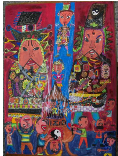
門神 · 五甲 林文郁