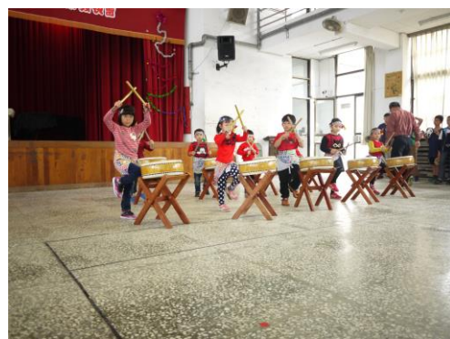
參與學校舉辦的耶誕節才藝發表會活動