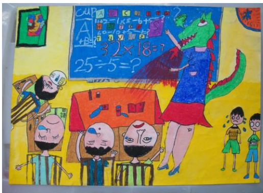
可怕的數學課 · 三甲 陳佳樂