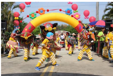
校慶剪影—舞獅表演