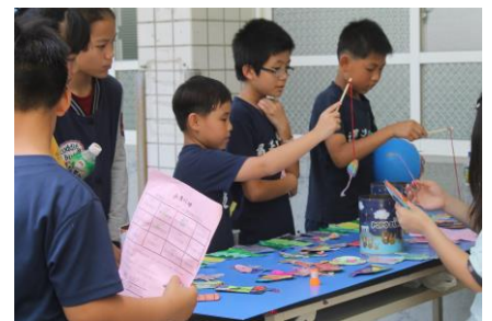
校慶剪影—闖關活動