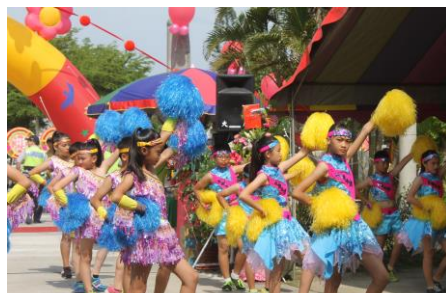
校慶剪影—火燈舞表演