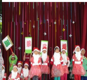
成果發表會—聖誕弟子規