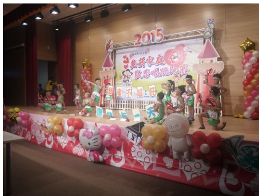
參加「無菸家庭 歡樂唱跳」比賽活動