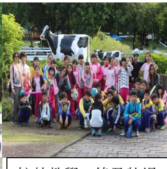
校外教學—綠盈牧場