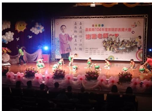
受邀參與嘉義縣 104 年教師節的開場表演