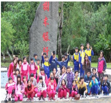
校外教學—樹木銀行